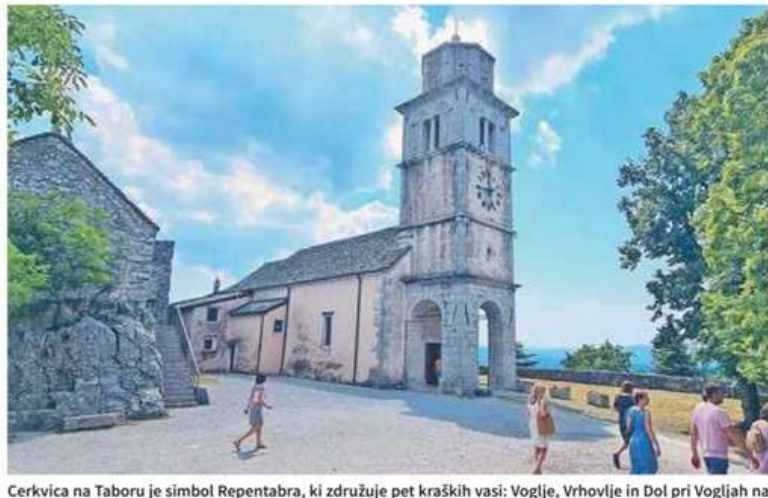
Cerkvica na Taboru je simbol Repentabra, ki združuje pet kraških vasi: Voglje, Vrhovlje in Dol pri Vogljah na slovenski strani, Repen in Col s Poklonom pa v Italiji.

KRAS • Čezmejni geopark Kras-Carso še čaka na uradno ustanovitev