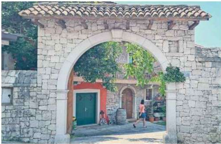
Tradicionalna kraška domačija ima zaprto dvorišče (borjač) in kamniti portal (kaluna).